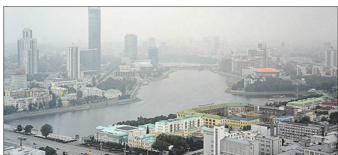
В августе синоптики уже трижды предупреждали свердловчан о смоге