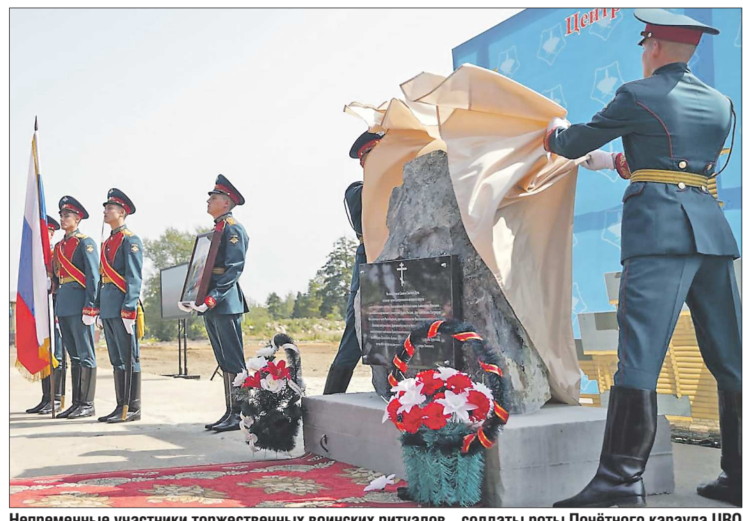
Непременные участники торжественных воинских ритуалов - солдаты роты Почётного караула ЦВО

«С тяжелым сердцем вынужден принять решение о закрытии Телевизионного Агентства Урала и новостей «Девять с половиной». До 1 сентября, до 27-й годовщины ТАУ мы еще, наверное, дотянем, а потом все...», - написал на своей странице в «Фейсбуке» основатель ТАУ, ведущий программы новостей «Девять с половиной».