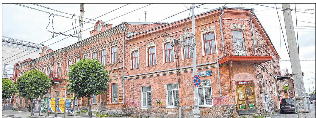
Дом на углу улиц Малышева и Горького был передан шахматистам в 2019 году. В этом же здании впоследствии должен разместиться музей шахмат

Подготовлено в соответствии с критериями, утвержденными приказом Департамента информационной политики Свердловской области от 09.01.2018 №1