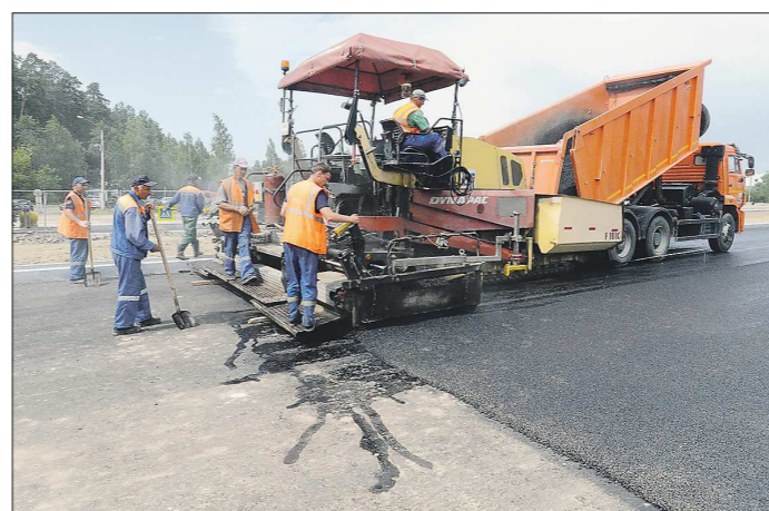
Участок дороги от Дюргюли до Ачит пройдёт через Республику Башкортостан, Пермский край и Свердловскую область

Подготовлено в соответствии с критериями, утверждёнными приказом Департамента информационной политики Свердловской области от 09.01.2018 №1 «Об утверждении критериев отнесения информационных материалов, публикуемых государственными учреждениями Свердловской области, в отношении которых функции и полномочия учредителя осуществляет Департамент информационной политики Свердловской области, к социально значимой информации».