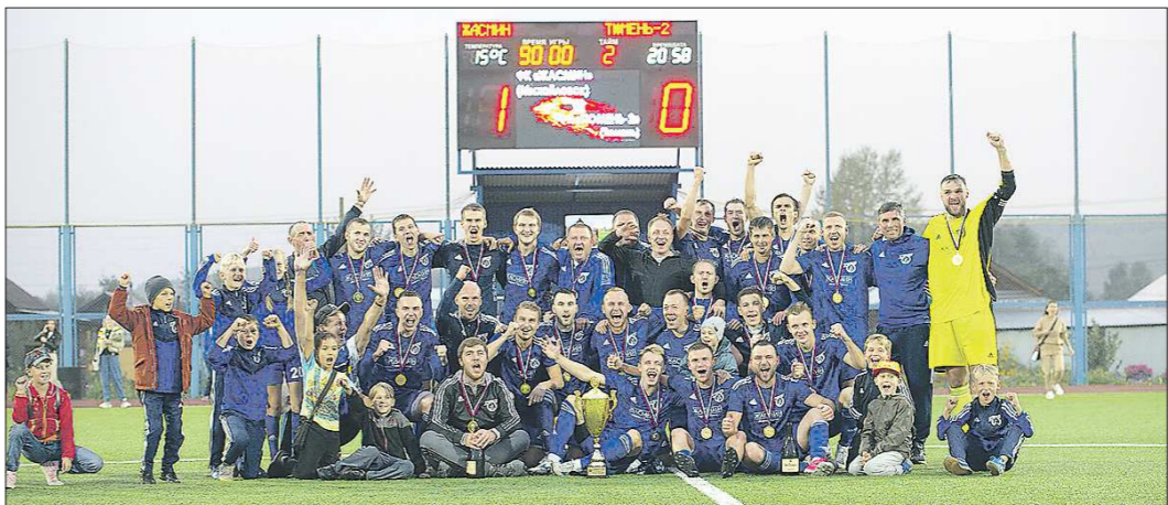
Победное фото. Главный тренер «Жасмина» отмечает, что команда — одна большая семья

Футбольный клуб из Михайловска «Жасмин» стал победителем Межрегионального этапа Кубка России. Михайловцы обыграли дублёров из ФК «Тюмень» и в следующем сезоне получат право сыграть в основной сетке Кубка России. Причём «Жасмин» впервые завоёвывал этот турнир и вышел из борьбы прошлогоднего победителя. «Областез» рассказывает историю клуба из Михайловска.