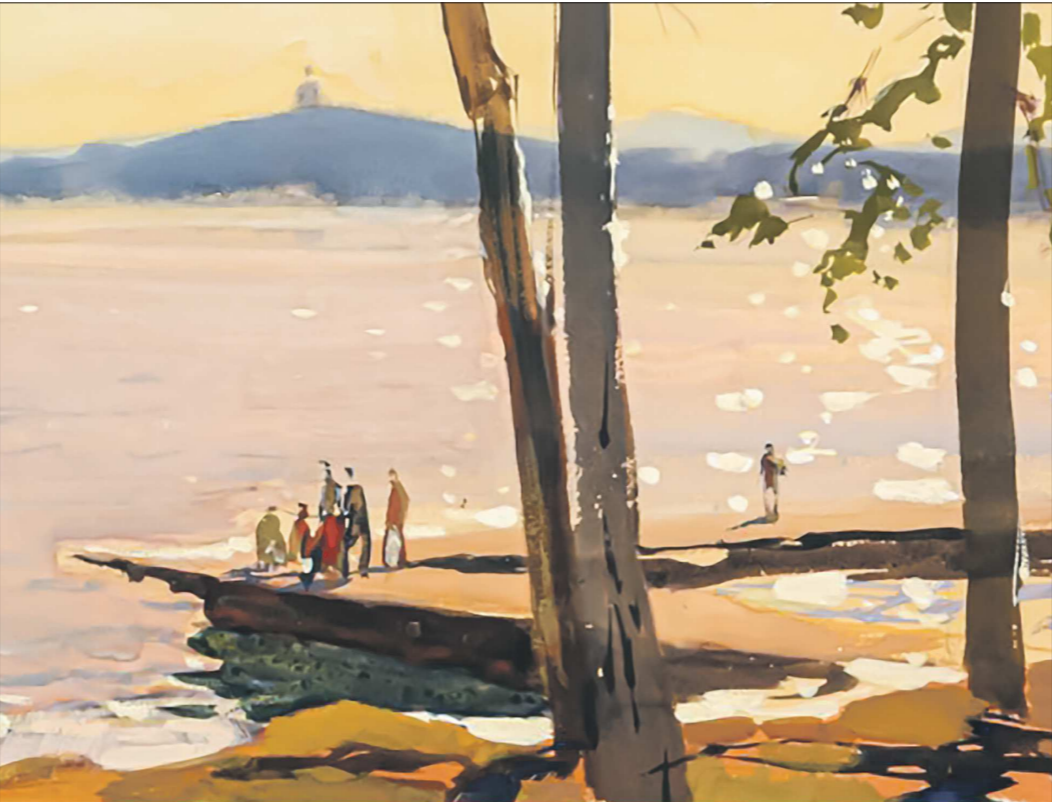
Один из пейзажей Нижнего Тагила. Вид на пруд и Лисью гору