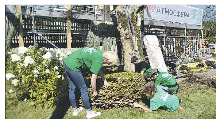
Сейчас сад на площади 1905 года почти готов к приходу гостей

Участников из разных регионов, которые создают сады и соревнуются, в этом году нет: единое зелёное пространство с плавными формами воплощает в жизнь одна команда организаторов. Возводить парк на твёрдом покрытии непросто, и в ход идут деревья с очень компактной корневой системой.