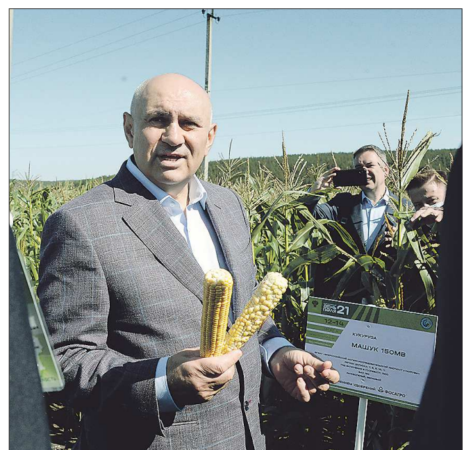
На фото – первый заместитель министра сельского хозяйства РФ Джамбулат Хатуов

Вчера в селе Кадниково Сысертского ГО начал работу Всероссийский день поля – самое масштабное событие в сфере агропромышленного комплекса, где демонстрируются различные сорта сельскохозяйственных культур, новинки сельхозтехники и оборудования, новейшие технологии. Впервые аграрная выставка такого масштаба проходит в Свердловской области. Почти 12 гектаров занимают опытные делянки, где высажено более 500 образцов сельскохозяйственных культур со всей России и из-за рубежа. В следующем номере мы расскажем подробнее об этом событии. Выставка будет работать до 14 августа