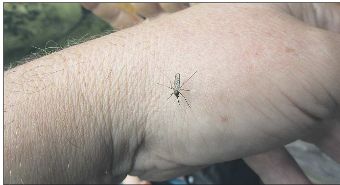
Этим летом комары в Свердловской области действительно встречаются не так часто

Однако для мух нынешние засушливые весна и лето