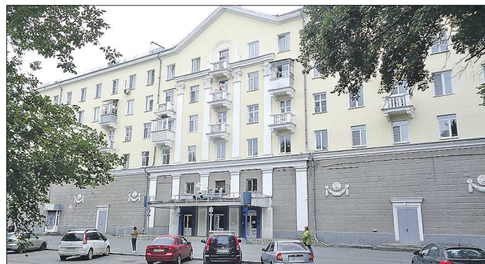
Вывеску «Знамя» со здания на Кировградской, 11 уже сняли. Внутри вовсю идёт ремонт

«Областага», к слову, рассказывала об идее сделать клуб в кинотеатре ещё в январе 2019-го. К ней можно было относиться по-разному, но какого-то конкретного воплощения она не получила. Затем грянула пандемия. С конца марта 2020 года кинотеатры за-