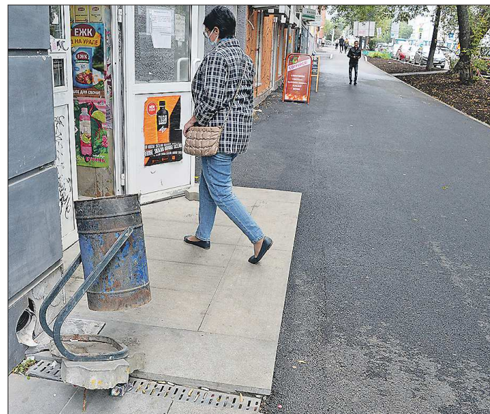
Кое-где остатки плитки ещё сохранились: урна, стоящая у продуктового магазина на улице Попова, видимо, весьма основательно была прикреплена к некогда лежащей здесь плитке, так что полностью снять прежнее покрытие не удалось

Одним из мест, где этим летом обновляют покрытие, стала улица Попова. В этом году дорожники ремонтируют её на участке от Вайнера до Московской. До начала работ здесь не было единства оформления: вдоль одного из домов были уложены и плитка, и асфальт. Сейчас этот недостаток исправляют, сделав выбор в пользу последнего.