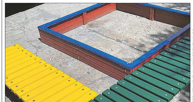
Переработка пластика сегодня – актуальный экологический тренд, чаще всего из пластиковых изделий делают уличные скамейки, урны, песочницы

Заводы, которые построят на основе франшизы «Умная среда», будут производить строительные материалы и жилищно-коммунальную мебель из переработанных полистирольных пакетов, твёрдых видов пластика и стретч-плёнки. Всего будет три завода.