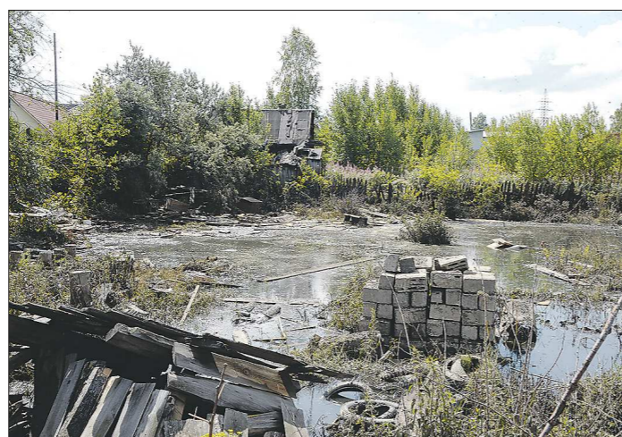
Вот так выглядели придомовые территории в Верхней Салде после затопления в июле

Материальная и финансовая помощь гражданам выплачена практически в полном объёме, – пояснила на