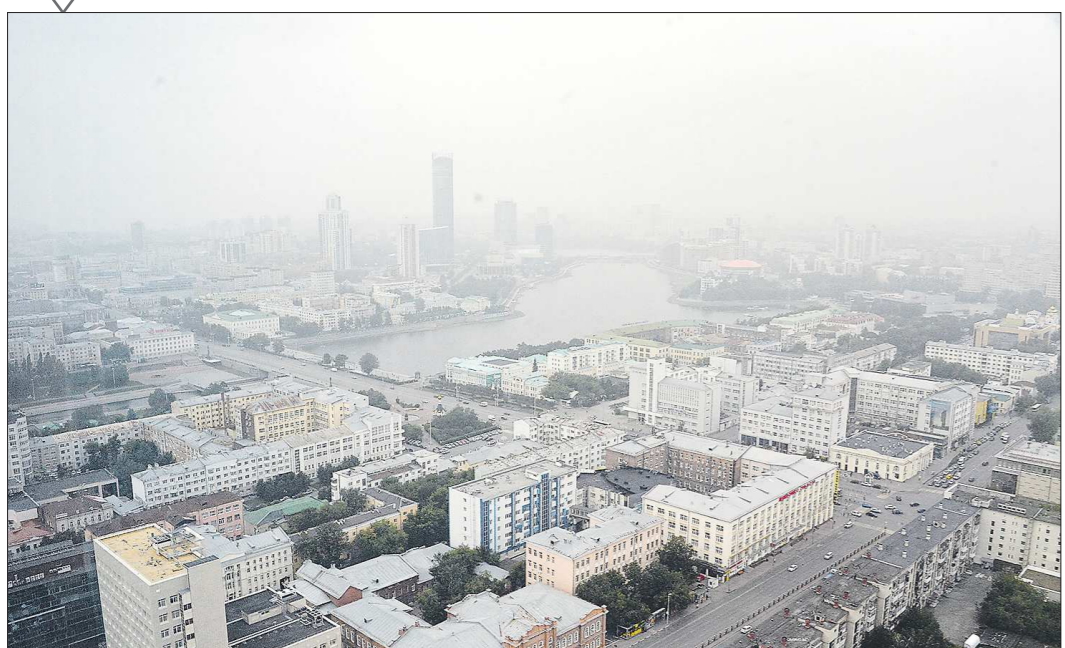
Уже два дня Екатеринбург живёт в мутно-белой дымке, многие жители жалуются на запахи гари. Откуда смог в уральской столице?

«Дым лесных пожаров из Якутии добрался до Среднего Урала»