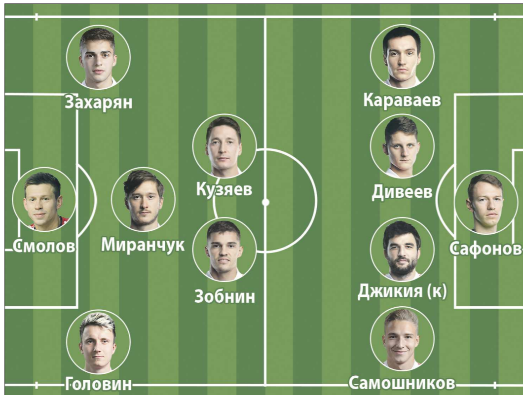
На наш взгляд, стартовый состав сборной России должен выглядеть так

При этом уважения к Юрию Жиркову и Фёдору Кудряшову, их время в сборной