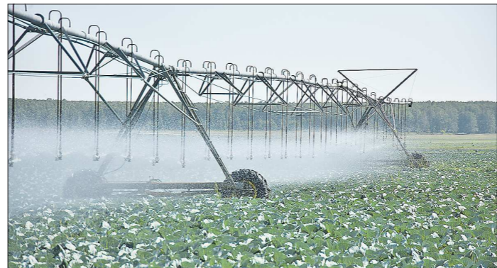
Современная поливальная установка. Покупка двух таких в этом году обошлась хозяйству в 25 миллионов рублей

новки, проложить километры труб. Но субсидируют нам всего 9 миллионов рублей от всех расходов, раньше компенсировали 50 процентов.