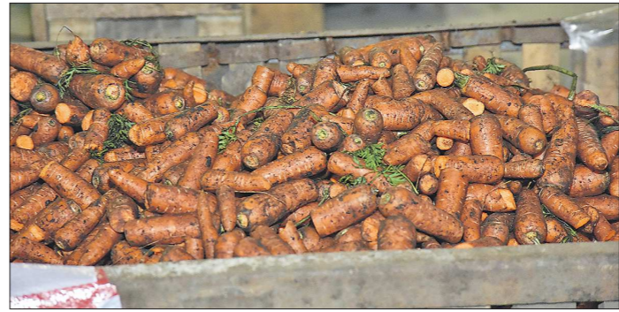
В нынешнем урожае уральской моркови велика доля нестандартных корнеплодов