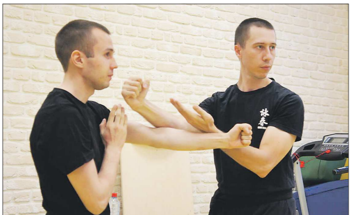
На занятиях Вин-чун тренеры покажут, как правильно выполнять каждое движение техники

В Свердловской области насчитывается более 20 тысяч детей с аутизмом, синдромом Дауна, детским церебральным параличом и другими особенностями здоровья. И, конечно, родителям этих ребят приходится непросто. – Мамы и папы таких детей испытывают серьёзную физическую и психологическую нагрузку. Из желания дать им возможность переадресовать и родился наш проект, – говорит инструктор Вин-чун Ни-