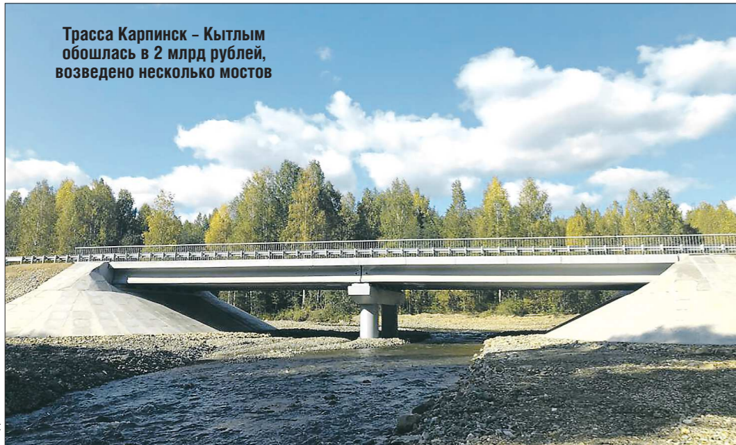
Трасса Карпинск – Кытлым обошлась в 2 млрд рублей, возведено несколько мостов