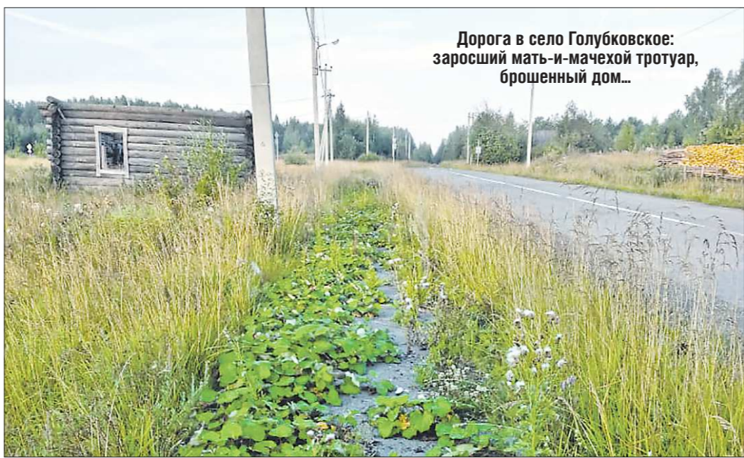
Дорога в село Голубковское: заросший мать-и-мачехой тротуар, брошенный дом...