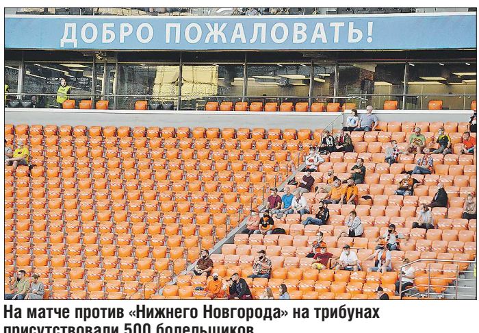
На матче против «Нижнего Новгорода» на трибунах присутствовали 500 болельщиков