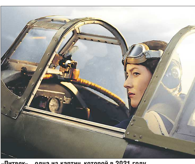
«Литвяк» – одна из картин, которой в 2021 году нужны средства для завершения работы

Фонд кино провёл очную защиту проектов компаний, не являющихся лидерами кинопроизводства.