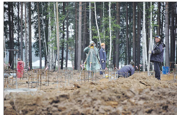
На каждый земельный участок должна быть составлена отдельная декларация

Переоценку земель проводят для того, чтобы привести кадастровую стоимость участков в соответствие рыночным ценам. Они в последнее время существенно выросли: по оценкам аналитиков, за год рост составил 10–20 процентов.