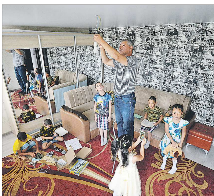
На три недели глава большой семьи остался на хозяйстве: он кашеварит, заплетает косички девчатам, отвозит мальчишек на занятия, меняет лампочки... Забот выше крыши!

Что вам больше всего нравилось из фантастики? В детстве я читал всё подряд – и произведения Айзек Ази-