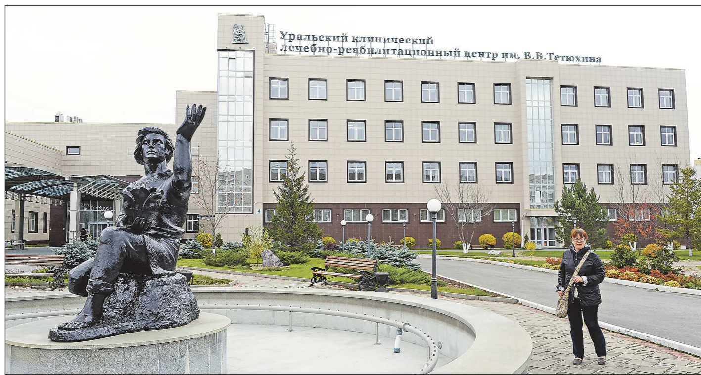
Областной арбитраж рассматривает взаимные претензии Корпорации развития Среднего Урала и госпиталя имени Владислава Тетюхина. Почему известный на весь регион госпиталь стал объектом судебных разбирательств?

Корпорация развития Среднего Урала через суд требует с медцентра 1,4 млрд рублей. У него таких денег нет