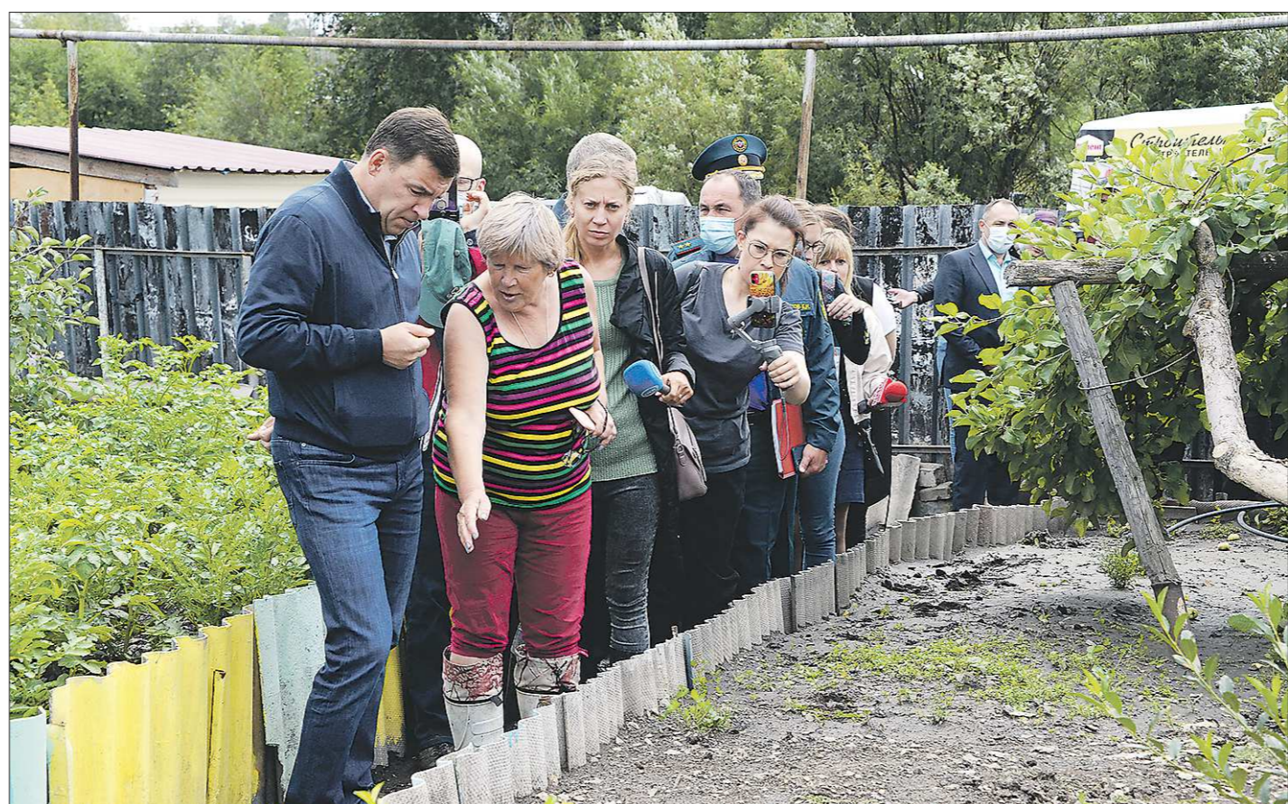
Евгений Куйвашев в Верхней Салде осмотрел объекты инфраструктуры и дома, пострадавшие от наводнения, встретился с местными жителями