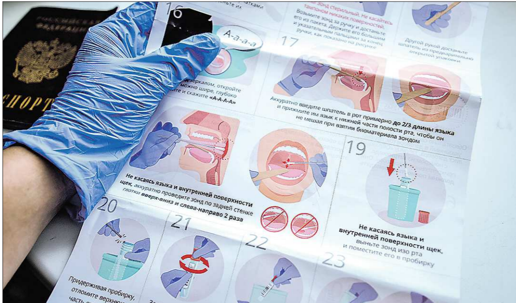
По мнению экспертов, экспресс-тесты на коронавирус для домашнего применения стоят всё равно подтвердить ПЦР-тестом