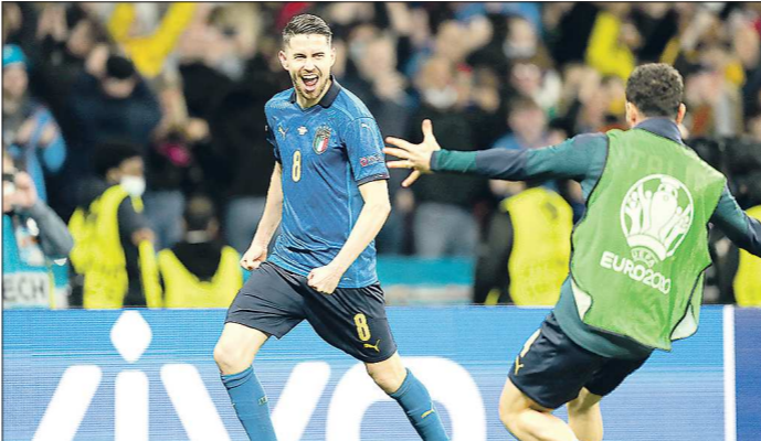
Жоржиньо забил решающий пенальти, который вывел Италию в финал Евро-2020