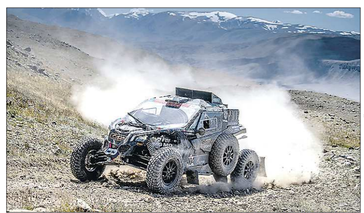
Свердловский экипаж на трассе «Шёлкового пути» - 2021»

— С марта по начало июля прошлого года у меня отменилось почти 60 концертов. Потом уже перестал считать. Часть тех, что были перенесены, сыграл позже, но это было тяжёлое время. Что касается