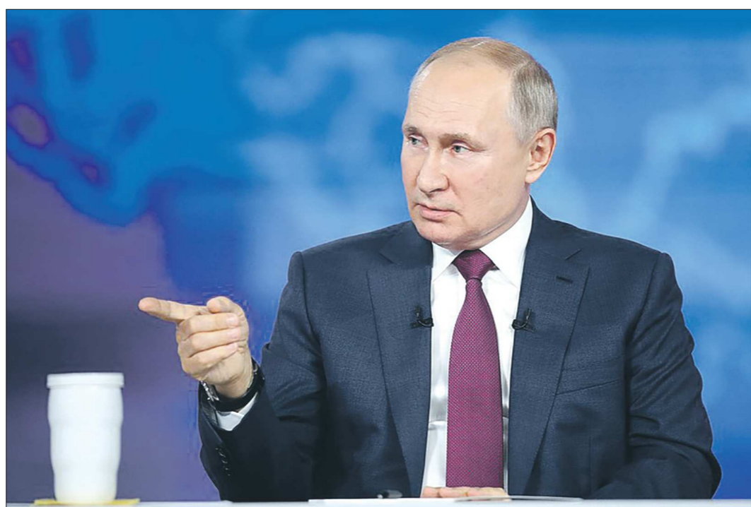
Владимир Путин: «Прямая линия» важна потому, что происходит выборка реальных проблем граждан. Действительно, бывает, что простые вопросы не получается решить без президента. Но нужно стремиться, чтобы всё работало в автоматическом режиме»

Глава государства также прокомментировал обращение жителя Москвы: жену мужчины, несмотря на медотвод, угрожали уволить в случае отказа от вакцинации. Президент обратил внимание на то, что такие действия противозаконны. Кстати, Владимир Путин также рассказал, что сам привился «Спутником V», хотя его прошили не называть поставленный препарат, чтобы не создавать конкурентных преимуществ. – У нас Вооружённые силы прививаются «Спутником», а я всё-таки верховный главнокомандующий, – сказал Владимир Путин.