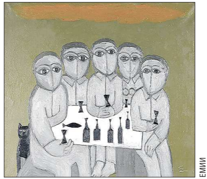
Адрес: Екатеринбургский музей ИЗО (ул. Воеводина, 5). Выставка открыта до 29 августа.

В Екатеринбургском музее ИЗО 25 июня открывается выставка художника, создателя «Музея простого искусства Урала и Сибири» Олега Елового (1967–2001). Он родился в Красноярском крае, а в столице Урала учился – в 1989 году окончил отделение дизайна Свердловского архитектурного института.