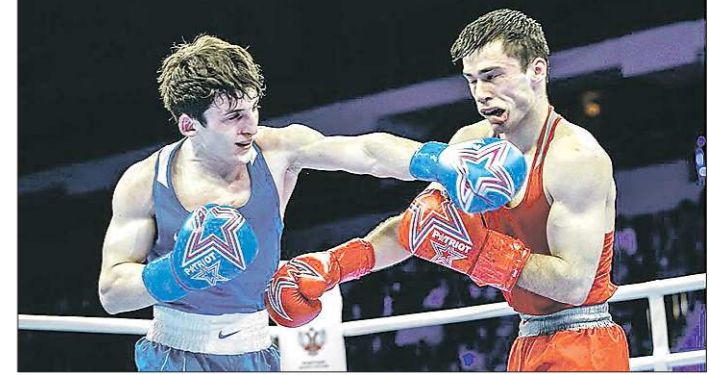
Командный Кубок России по боксу был возрожден в 2018 году после 12-летней паузы

В Екатеринбурге завершился командный Кубок России по боксу среди мужчин. В решающей встрече команда из Уральского федерального округа (УрФО) одержала победу над соперниками из Центрального федерального округа (ЦФО). Итоговый счёт – 16:14.