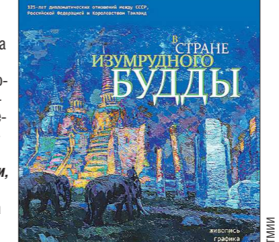
Адрес: Нижнетагильский музей ИЗО (ул. Уральская, 7). Выставка открыта до 1 августа.

В Нижнетагильском музее ИЗО открылась экспозиция «В стране Изумрудного Будды», приуроченной к 125-й годовщине установления дипломатических отношений между Россией и Таиландом. Эта выставка стала началом художественно-просветительского проекта, посвященного культуре двух стран.