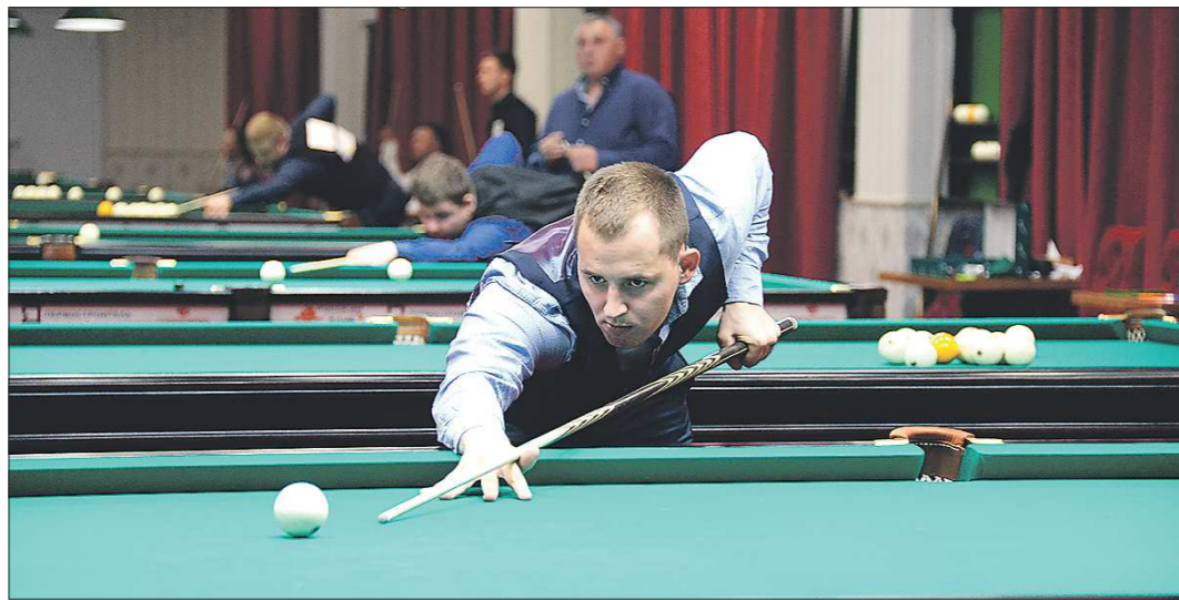
Среди участников турнира три заслуженных мастера спорта и тринадцать мастеров спорта международного класса

Всего за победу борются 82 участника – из России, Украины, Белоруссии, Узбекистана, Молдавии, Киргизии. К сожалению, не все смогли приехать из-за остающихся ковидных ограничений. Вступительный взнос 5 тысяч рублей. Призовой фонд турнира 1 миллион рублей будет распределён среди тех, кто войдёт в шестнадцать лучших, в том числе 320 тысяч получит победитель.