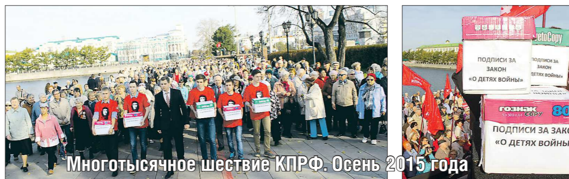
Многотысячное шествие КПРФ. Осень 2015 года