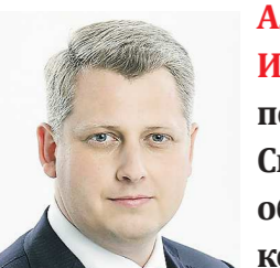
Александр ИВАЧЕВ, первый секретарь Свердловского областного комитета КПРФ:

В 2015-м жители Свердловской области сделали свой выбор в пользу общенародного областного референдума «О детях войны». В том году мы собрали требуемые российским законодательством 69 тысяч подписей, что составило 2% от числа избирателей региона.