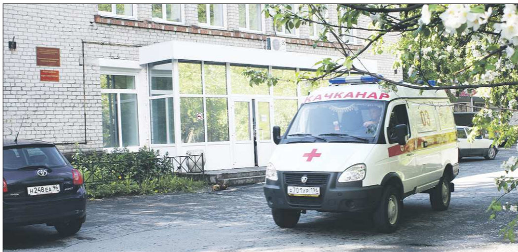
Качканарская городская больница обслуживает 8 тысяч детей и 32 тысячи взрослых

Главное медицинское учреждение Качканара обновляется стремительными шагами. Для городской больницы закуплены три новых автомобиля, а также цифровой маммограф, флюорограф, аппарат УЗИ и эндоскопы.