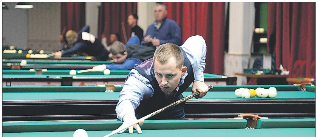
Среди участников турнира три заслуженных мастера спорта и тринадцать мастеров спорта международного класса