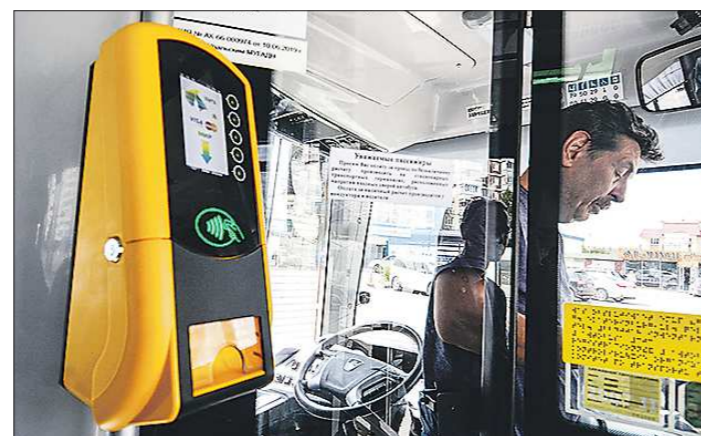
Скоро валидатор и водитель заменят кондуктора