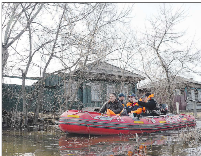
На моторной лодке спасатели выходят на воду