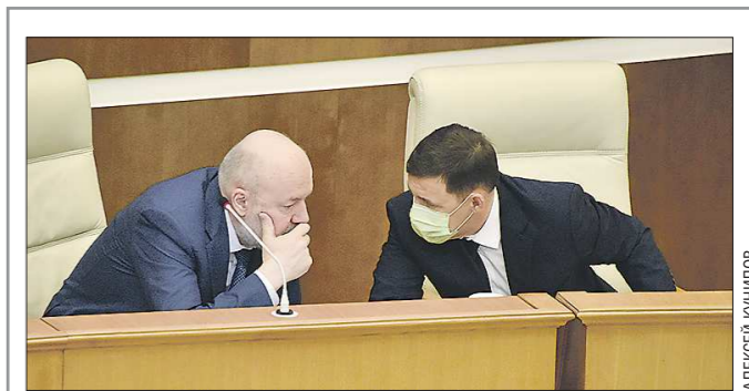
Павел Крашенинников и Евгений Куйвашев: законодательная и исполнительная власть всегда найдут общий язык

Подготовлено в соответствии с критериями, утверждёнными приказом Департамента информационной политики Свердловской области от 09.01.2018 №1 «Об утверждении критериев отнесения информационных материалов, публикуемых государственными учреждениями Свердловской области, в отношении которых функции и полномочия уполномоченного осуществляет Департамент информационной политики Свердловской области, к социально значимой информации».