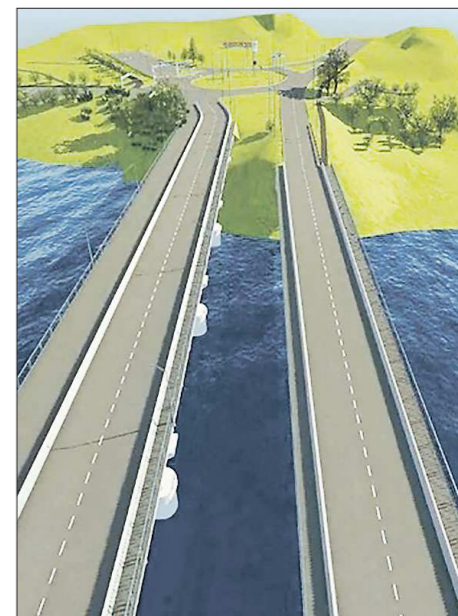
Городские власти решили проложить через реку мост-дублёр – он избавит дорожную сеть от заторов (на фото – один из вариантов, как это будет выглядеть). Запустить его планируется уже через четыре года