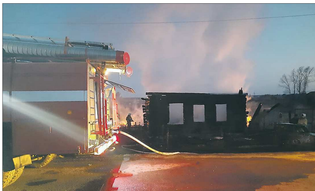
К моменту прибытия огнеборцев кровля деревянного дома успела обрушиться: сообщение о пожаре поступило слишком поздно

В селе Бызово Горноуральского городского округа в ночь на 15 апреля произошёл пожар в частном доме на улице Рябиновой. Там проживала многодетная семья, в которой было семеро детей. Спасти из огня удалось только взрослых и двум малышам. Пятеро детей, старшая из которых училась в первом классе, погибли.