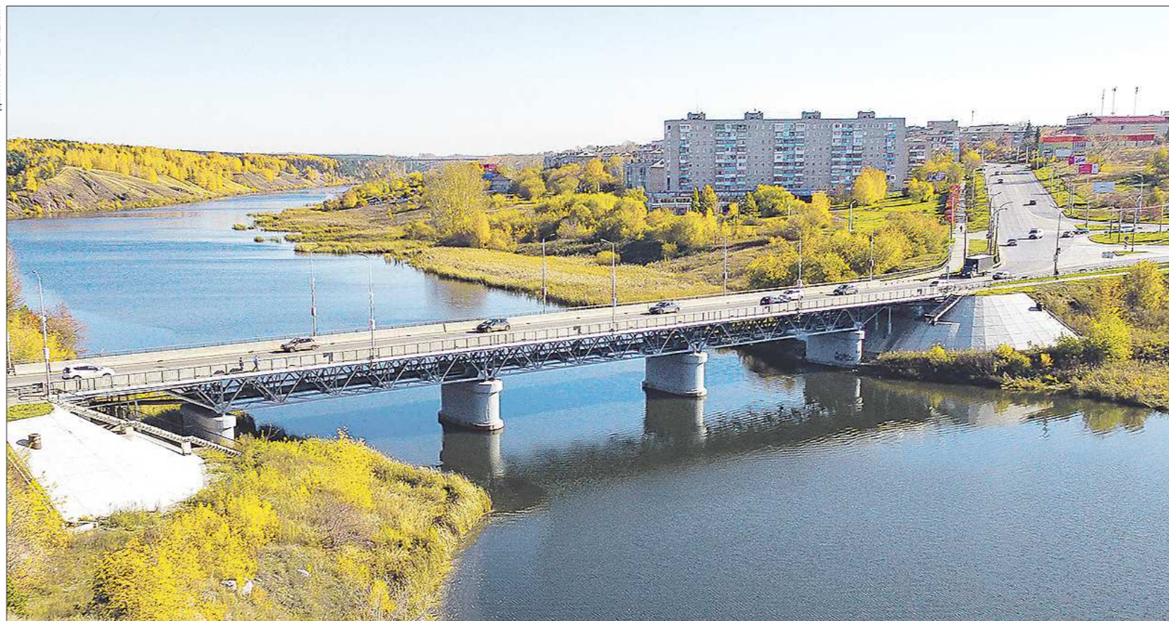
Байновский мост в Каменске-Уральском стоит на реке Исеть. Он связывает два крупнейших района города, и каждый день по нему движутся тысячи машин. Другого моста нет, хотя он очень нужен жителям