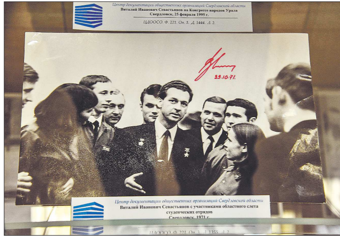
Встреча космонавта Виталия Севастьянова с участниками областного слёта студенческих отрядов Свердловской области, 1971 год

К Дню космонавтики в Центре документации общественных организаций Свердловской области открылась международная архивная выставка «Урал – Казахстан: след в открытом космосе». В экспозицию вошли 165 уникальных фотографий и документов, рассказывающих о вкладе нашего региона в освоение околоземного пространства и космонавтах-уральцах – от Павла Беляева до Сергея Проккопева.