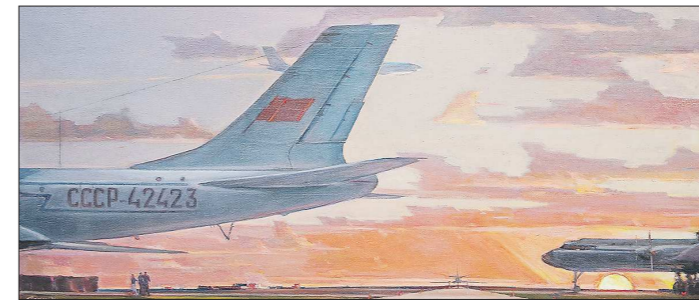
Символом экспозиции стала картина Георгия Нисского «Аэродром»