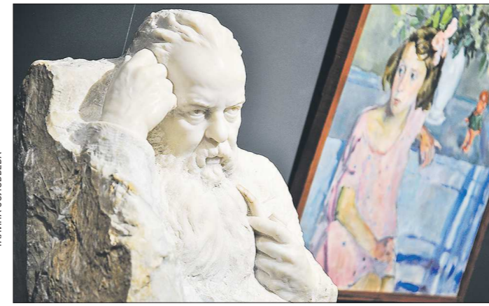
Гали Петрова. «Портрет Бажова»