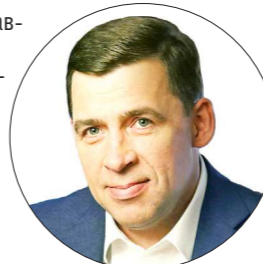
Губернатор Свердловской области Евгений КУЙВАШЕВ