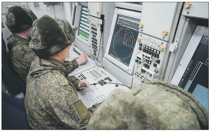
Боевые расчёты частей, оснащённых зенитно-ракетными системами С-400, постоянно несут боевое дежурство