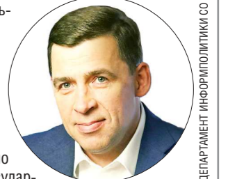
ДЕПАРТАМЕНТ ИНФОРМАЦИОННОЙ ПОЛИТИКИ СО

Губернатор Свердловской области Евгений КУЙВАШЕВ