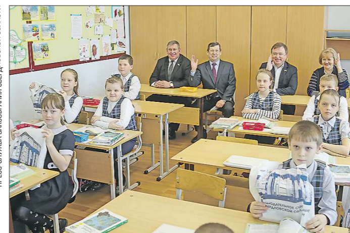
После церемонии гости посетили действующую школу – побывали на уроке физкультуры и даже посидели за партами

Школа будет построена в рамках государственной программы по комплексному развитию сельских территорий и госпрограммы Свердловской области «Развитие агропромышленного комплекса и потребительского рынка». Общий объём финансирования составил 391,5 миллиона рублей, из них 92 процента – федеральные ресурсы.