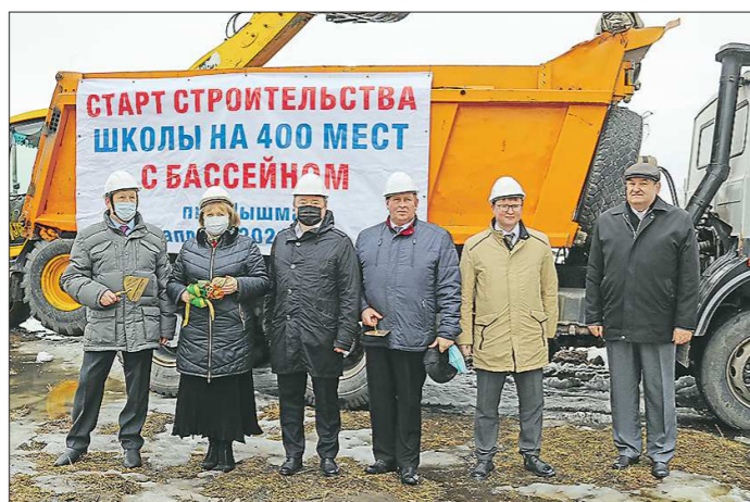
Участники мероприятия сфотографировались на память на фоне работающей техники