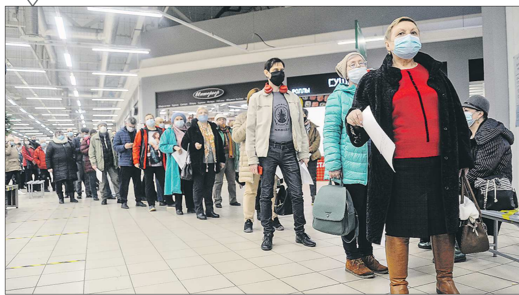
Гипермаркет «О'кей» на улице Бабушкина в Екатеринбурге снова стал площадкой для проведения вакцинации от COVID-19. В минувшую пятницу там образовалась длинная очередь из желающих поставить прививку. По оценке фотокорреспондента «ОГ», в ожидании препарата находились более ста человек. Почти все желающие прививаться – в масках. Но насколько эффективно это средство в защите от коронавируса?