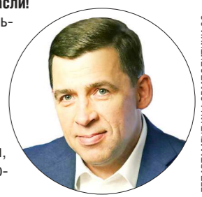
ДЕПАРТАМЕНТ ИНФОРМАЦИОННОЙ ПОЛИТИКИ

Губернатор Свердловской области Евгений КУЙВАШЕВ