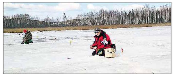
Соревнования по подлёдному лову, наверное, одни из самых тихих

На озере Исетское в Среднеуральске прошёл чемпионат Свердловской области по спортивной ловле рыбы на мормышку со льда. Казалось бы, уже весна и выходить на лёд опасно, но организаторы мероприятия уверяют, что всё учли в соответствии с требованиями безопасности.