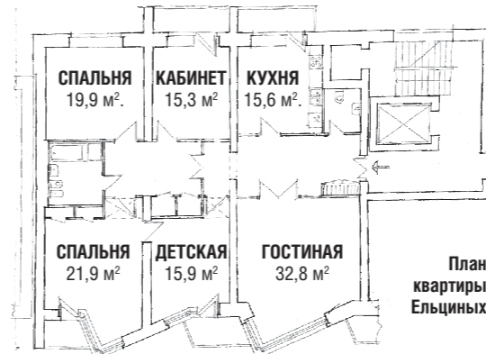
План квартиры Ельциных