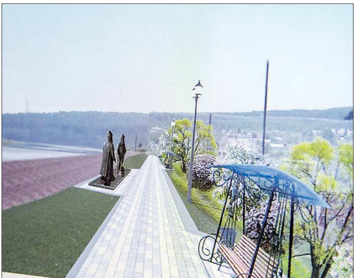
Возле водопада гостей встретят скульптуры бывлых хозяев здешних мест – Александра Строганова и Акиффия Демидова

Несмотря на общее снижение экспорта Свердловской области в 2020 году, объём вывоза товаров в Узбекистан показал рост. За 9 месяцев прошлого года он увеличился на 18 процентов по сравнению с аналогичным периодом предыдущего года и составил 225 миллионов долларов США.