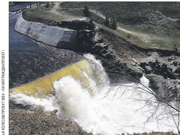
Так сейчас выглядит Висимо-Уткинский водопад. После благоустройства он будет подсвечиваться