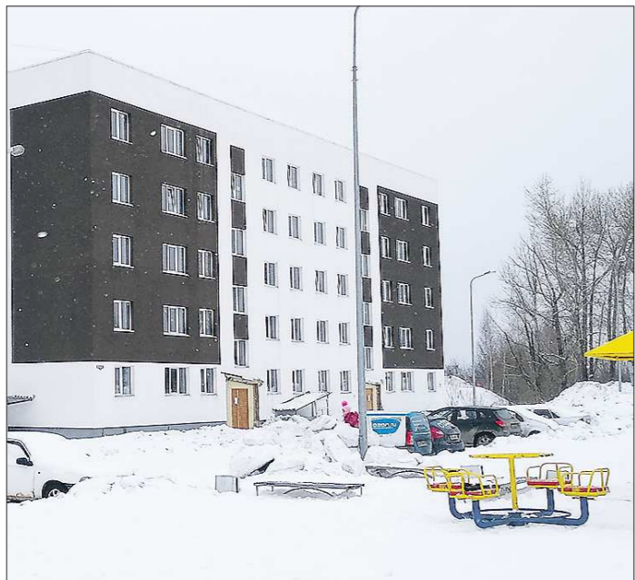
Дом для выпускников детдома был заселен в декабре 2019 года. Выглядит симпатично, если не спуститься в подвал: дверь, ведущая туда, вмёрзла в дурно пахнущий лёд

Получали ключи от своих квартир молодые люди с хорошим настроением. Правда, дом на самой окраине города, горячая вода из бойлера, на дверях пропуская иней, не горят уличные фонари, но всё это вторично. Главное же — есть надежная крыша над головой, и через пять лет однуш-