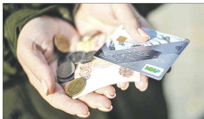
Нововведения позволят повысить уровень защиты прав потребителей – держателей карты «Мир», в число которых входят работники бюджетной сферы, пенсионеры, военнослужащие, получатели социальных выплат

Кроме того, у пользователей появится возможность требовать от оператора удаления сведений о себе. Об этом говорится в законе от 30 декабря 2020 года №519-ФЗ «О внесении изменений в Федеральный закон «О персональных данных».