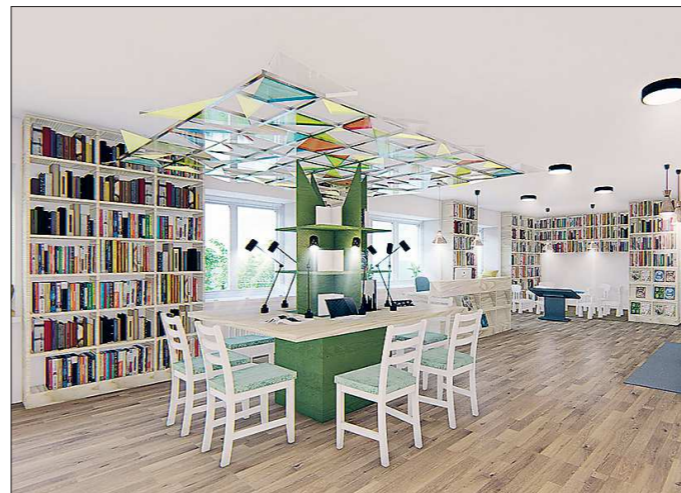
Так будет выглядеть один из залов библиотеки после капитального ремонта

Подготовлено в соответствии с критериями, утверждёнными приказом Департамента информационной политики Свердловской области от 09.01.2018 №1 «Об утверждении критериев отнесения информационных материалов, публикуемых государственными учреждениями Свердловской области, в отношении которых функции и полномочия учредителя осуществляет Департамент информационной политики Свердловской области, к социально значимой информации».