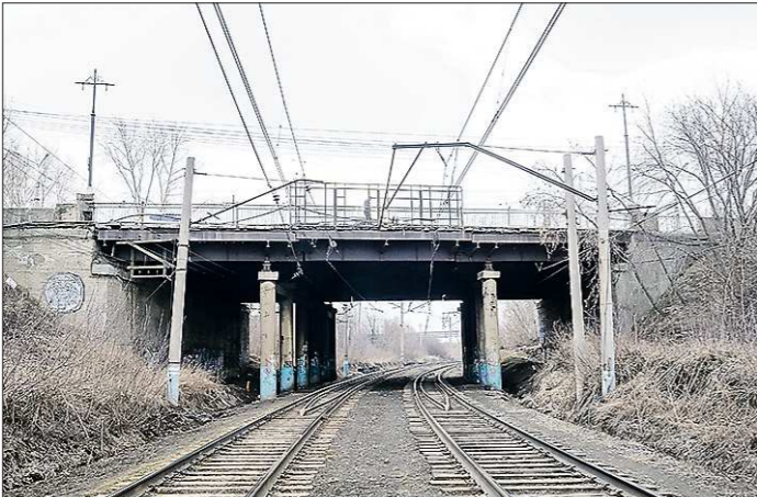
Почти все мостовые опоры необходимо менять – за годы эксплуатации они износились

Непростую транспортную проблему предстоит решить властям Нижнего Тагила. В этом году закрывается на реконструкцию путепровод на улице Циолковского – он связывает Тагилстройский район с центром города. Движение автотранспорта и пешеходов по нему будет полностью остановлено. Жители бьют тревогу: как добираться до работы, детских садов и школ? Встревожены и медики: как транспортировать тяжелобольных пациентов? Между тем, в мэрии города уверяют, что варианты объездных путей уже прорабатываются. И впадать в панику не стоит.