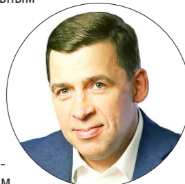
ДЕПАРТАМЕНТ ИНФОРМАЦИОННОЙ ПОЛИТИКИ

Губернатор Свердловской области Евгений КУЙВАШЕВ