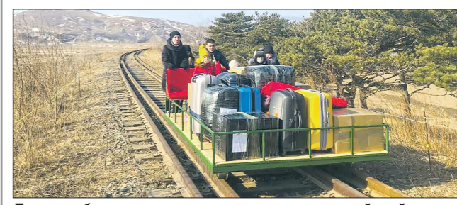
Дрезина была построена сотрудниками российской компании «РэсонКонТранс» специально для экстренного вывоза граждан РФ с территории КНДР

Восемь россиян – сотрудников посольства России в КНДР и членов их семей вернулись на родину. Поскольку границы между нашей страной и Северной Кореей закрыты из-за пандемии коронавируса, им пришлось проделать часть пути на самоходной дрезине.