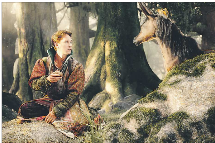
Съёмки проходили в специальном павильоне под Санкт-Петербургом. Его общая площадь - 7 000 квадратных метров