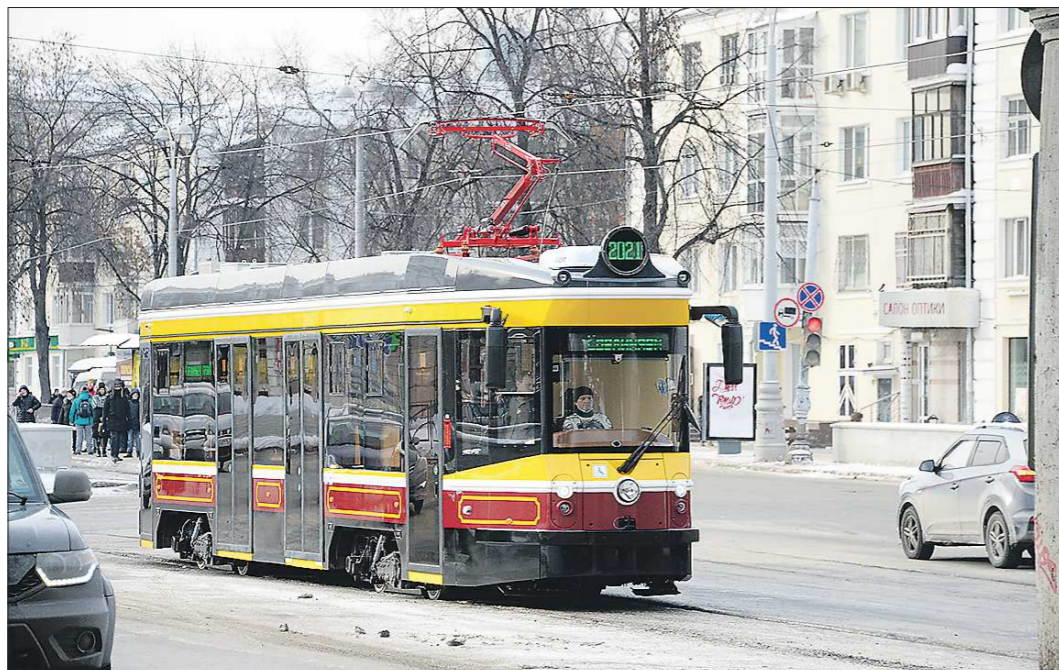
«Уралтрансмаш» планирует начать серийное производство ретро-трамваев, сообщает официальный сайт компании

Трамвай модели 71-415P в стиле ретро – новейшая разработка компании «Уралтрансмаш» (в составе концерна «Уралвагонзавод» входит в госкорпорацию «Ростех»). В конце прошлого года машину презентовали губернатору Свердловской области Евгению Куйвашеву . Глава региона назвал трамвай «отличной идеей» и предложил использовать его исключительно как экскурсионный – для привлечения туристов на Средний Урал (кстати, подобный транспорт уже действует в Санкт-Петербурге и Москве). Как сообщили в «Уралтрансмаше», в январе нынешнего года машина пришла в Западное депо Екатеринбург-