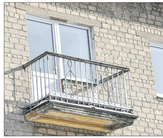
На балконе видны декоративные элементы, похожие на скрипичные ключи — на балконе предыдущей квартиры Ельциных по улице Грибоедова, 14 были такие же украшения