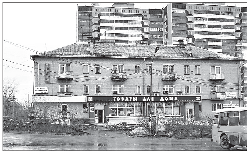
Архивная фотография дома по ул. 8 Марта, 179в, сделанная в 2006 году. С тех пор внешний облик верхних этажей практически не изменился