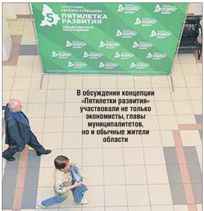
В обсуждении концепции «Пятилетки развития» участвовали не только экономисты, главы муниципалитетов, но и обычные жители области