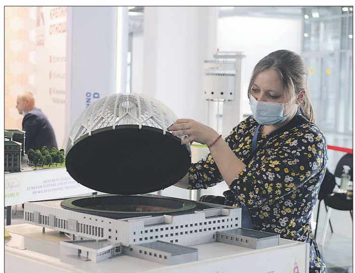
На форуме 100+TechBuild гостей и участников просили не нарушать масочный режим. А вип-гостям постоянно обрабатывали руки антисептиком