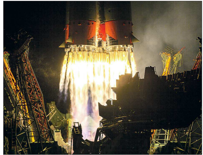
Использование уральской технологии позволит России продвигнуться в создании ракетных двигателей нового поколения

На этой неделе учёные из Института высокотемпературной электроники УрО РАН рассказали журналистам о прорывной научной технологии, внедряемой на предприятиях Роскосмоса в Подмосковье и Калининградской области. Ноухау позволит создать новые двигатели для спутников и многоразовых ракет, разработкой которых сейчас занимаются инженеры в соседней Челябинской области.