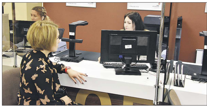
В МФЦ рассчитывают увеличивать количество документов, которые могут получить уральцы, обращаясь только в их организацию