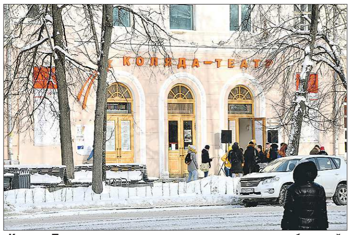
«Коляда-Театр», вероятно, может претендовать на наибольший грант Министерства культуры