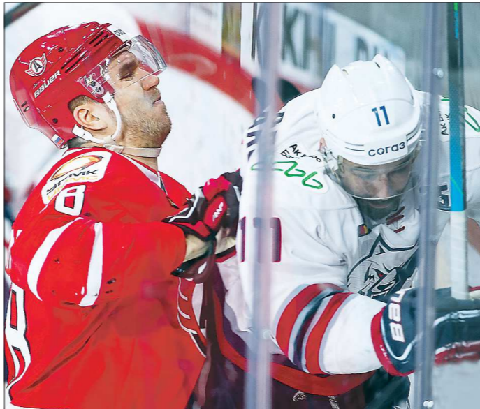
Для успешного выступления в плей-офф всем игрокам «Автомобилиста» надо приложить максимум усилий

Ситуация в турнирной таблице сейчас такова, что выше пятого места наша команда вряд ли поднимется, а это значит, что ни в одном из раундов плей-офф у неё не будет преимущества своей площадки. Ещё одна деталь – ни с