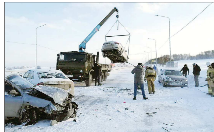
В массовой аварии на трассе Екатеринбург – Челябинск пострадали 20 машин

Но главный «сюрприз» ожидал свердловчан в воскресенье. Резкое понижение температуры до -11 градусов и ухудшение погодных условий в ночь с суб-