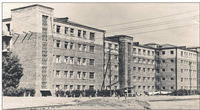
Так выглядело здание студенческого корпуса № 6 УПИ во времена учёбы Бориса Ельцина (вид с улицы Комсомольской)