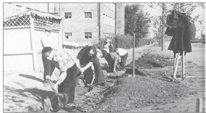
Студенты стройфака УПИ высаживают деревья и кустарники в палисаднике общежития № 6. 1950-е годы