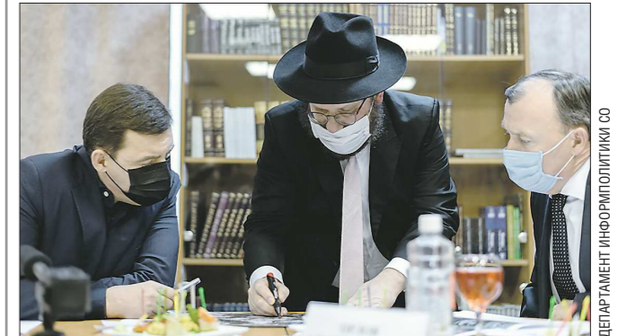
Евгений Куйвашев в День памяти жертв холокоста провёл встречу с главным раввином Екатеринбурга и области Зелигом Ашкенази

С такой инициативой выступил Еврейский центр «Синагога». Идея обсуждалась в Международный день памяти жертв холокоста с главным раввином Екатеринбурга и области Зелигом Ашкенази.