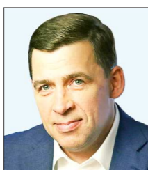
Евгений КУЙВАШЕВ , губернатор области (был главой администрации Тобольска и Тюмени)