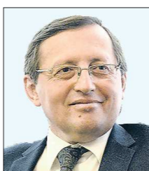
Павел КРЕКОВ , замгубернатора (был замглавы администрации Тобольска по соцвопросам)