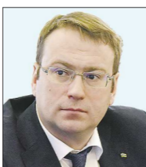
Алексей КУЗНЕЦОВ , министр природных ресурсов и экологии (был директором департамента жилищной политики Тюмени)