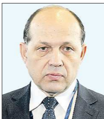
Михаил ВОЛКОВ , министр строительства и развития инфраструктуры (был замглавы департамента архитектуры, градостроительства и регулирования земельных отношений администрации Екатеринбурга)