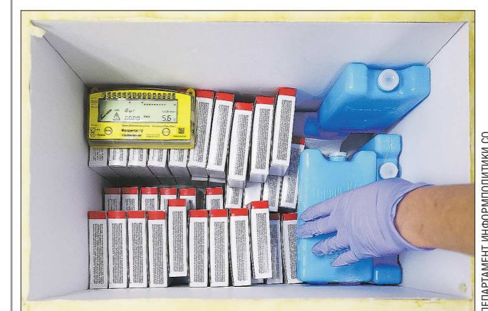
Отличие второй вакцины от первой («Спутник V») – в условиях транспортировки и хранения

Накануне на Средний Урал доставлен препарат «Эпи-ВакКорона» производством научного центра «Вектор». Прибывшая партия рассчитана на вакцинацию тысячи человек.