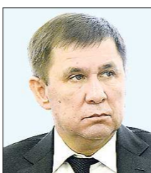
Сергей ШВИНДТ , замгубернатора (был замглавы администрации Екатеринбурга)