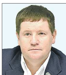
Сергей БИДОНЬКО , вице-губернатор (был мэром Карпинска)