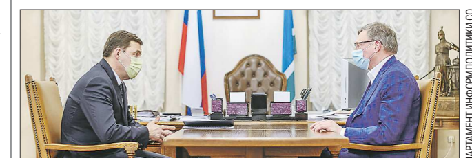
Александр Бурков (на фото справа) является уроженцем Свердловской области, на протяжении почти 10 лет он представлял регион в Госдуме

Главы Свердловской и Омской областей обсудили направления сотрудничества между регионами.