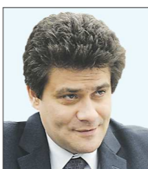
Александр ВЫСОКИНСКИЙ , первый замгубернатора (был главой администрации Екатеринбурга)