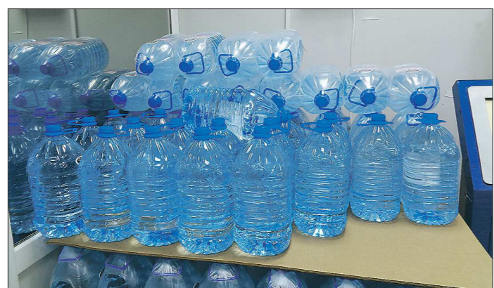
Эксперты Роскачества снизили оценку многих торговых марок воды на Среднем Урале, заподозрив их в фальсификате

В середине рейтинга оказались марки уральской воды «Родниковая слеза», «Чистогорье» и «Чувская». Все признаны безопасными по гидроксидным показателям, в воде эксперты не нашли опасных для здоровья веществ, а также признаков хлорирования. Но к каждой нашлись претензии. Например, по поводу «Чистогорья» заявили: «Указание о природном происхождении воды в виде названия «Природная», предусмотренное тех-