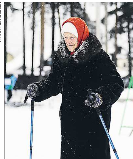
Не берут кататься на лыжах – займёмся скандинавской ходьбой