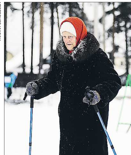
Не берут кататься на лыжах – займёмся скандинавской ходьбой

Со списком победителей можно ознакомиться на сайте oblgazeta.ru