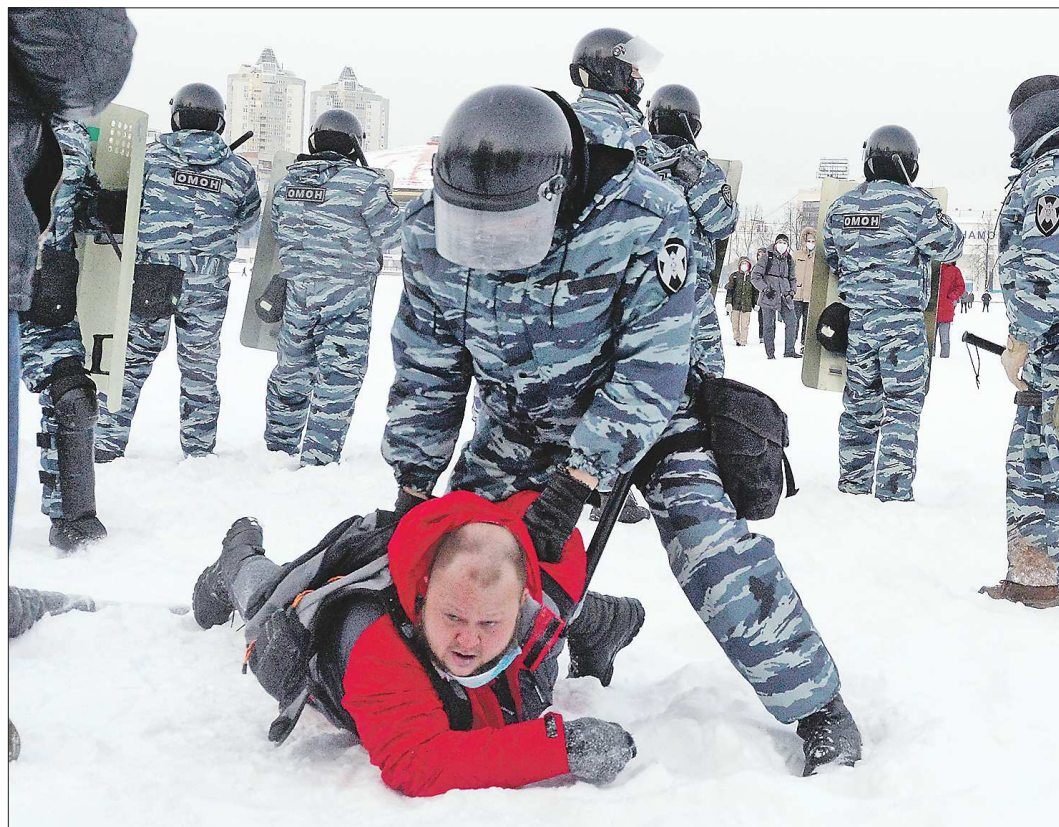
Большая часть задержаний произошла на Городском пруду

Напомним, что Навальный имеет две непогашенные судимости. Он был одним из обвиняемых по так называемому «делу Ив Роше» (Алексей и его брат Олег обвиняли в навязывании фирме посредника в транспортно-логистических услугах в лице своей фирмы «Главпики»). 30 декабря 2014 года Олег был приговорен к 3,5 года лишения свободы, а Алексей — к условному сроку на те же 3,5 года и испытательному сроку в пять лет (последний позже был продлен до 30 декабря 2020 года).