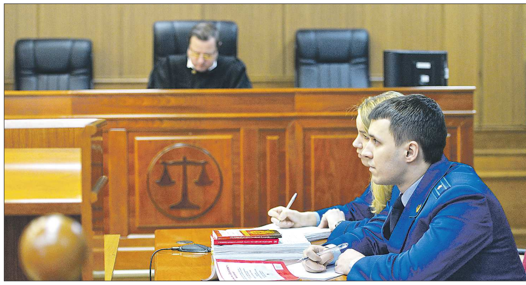
От показаний свидетеля нередко зависит исход дела

В Невьянске завершили расследование уголовного дела против четырех дельцов, которые организовали подпольное казино в поселке Верх-Нейвинском. Организаторы теневого бизнеса вину признали, а вот трое игроков отказались давать показания. И проиграла: за пользование услугами казино не наказывают, а вот за отказ от дачи свидетельских показаний предусмотрена ответственность. Поэтому статус свидетелей сменился на обвиняемых – их приговорили к обязательным работам. Такие случаи – не редкость. Рассказываем, чем важна роль свидетеля.