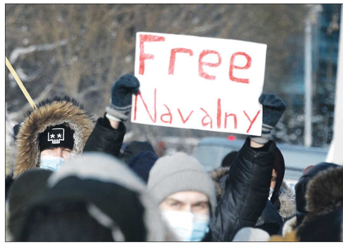
Фраза «Свобода Навальному» написана на английском — явно для того, чтобы её фото или видео можно было использовать в западных СМИ

После этого силовики приступили к активным действиям — стали вытеснять толпу с площади у Театра драмы на лёд Городского пруда. Задержание продолжились. Складывались впечатления, что ОМОН, сотрудники Росгвардии и полиция действуют выборочно: высмаркивают и задерживают провокаторов.