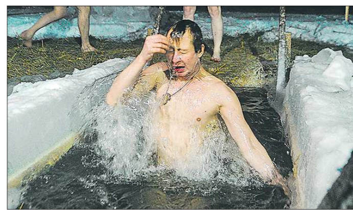
Ночные крещенские купания на Шарташе – проруби не пустовали до двух часов ночи

Подготовлено в соответствии с критериями, утвержденными приказом Департамента информационной политики Свердловской области от 09.01.2018 №1 «Об утверждении критериев отнесения информационных материалов, публикуемых государственными учреждениями Свердловской области, в отношении которых функции и полномочия учредителя осуществляет Департамент информационной политики Свердловской области, к социально значимой информации»